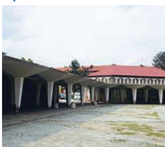
FALCHERA Un angolo della Falchera da recuperare